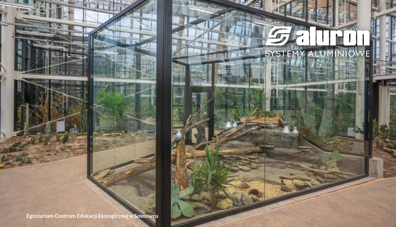
Egzotarium Centrum Edukacji Ekologicznej w Sosnowcu