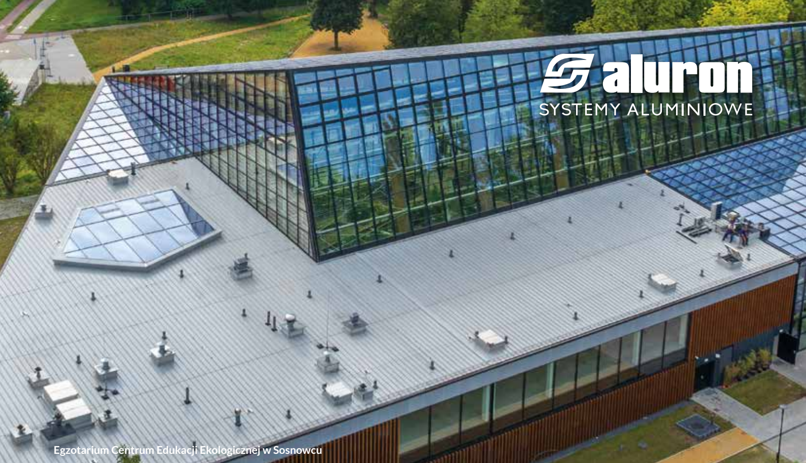
Egzotarium Centrum Edukacji Ekologicznej w Sosnowcu